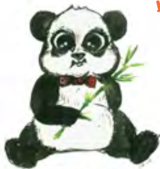
MIKA le Panda®